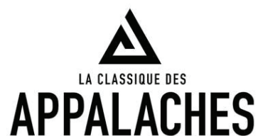
CLASSIQUE (PAS DE REFLETS, NI D'OMBRES, NI DÉGRADÉS)